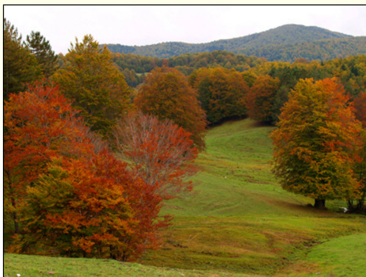
Paesaggio autunnale - sullo sfondo il monte Femminamorta