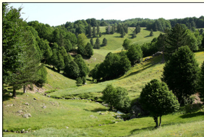
La valle del fiume Soleo