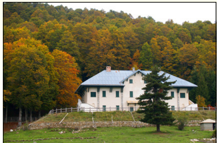
Caserma forestale del Gariglione