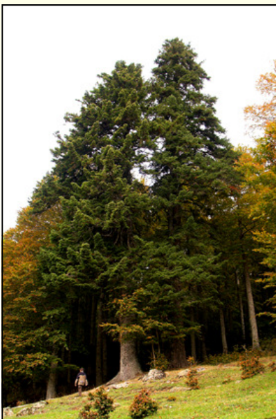
Esemplare di abete nella foresta