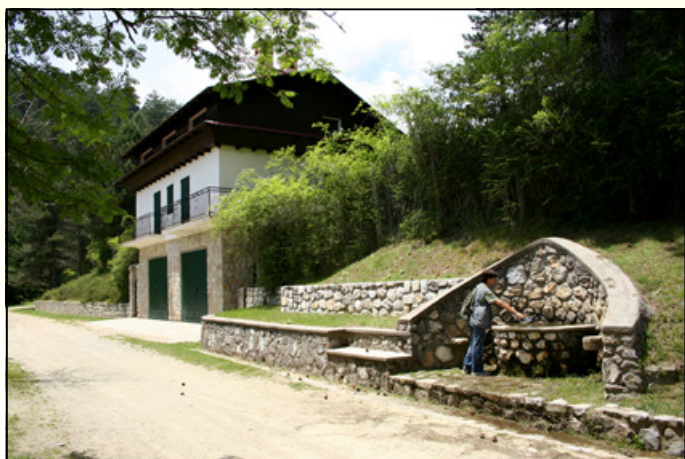
Casermetta di Roncino