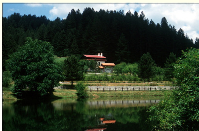
Vivaio e laghetto