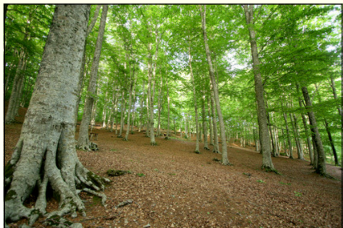
Faggeta sul monte Condronò