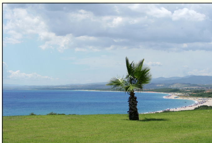
Steccato di Cutro - loc. Praialonga