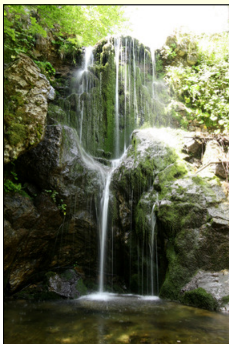
Cascata nella valle del Tacina