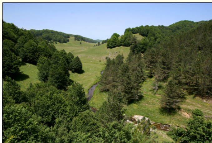
Alta valle del Tacina